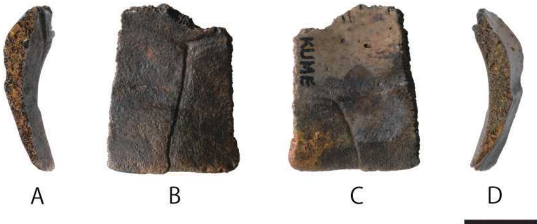
図2. 久米島の沖地に分布する石灰質に富む堆積物から発見されたイシガメ科の一種の左第9縁板 (RUMF-GF-5016)。A, 前方観; B, 背面観; C, 腹面観; D, 後方観。スケールバーは1 cmを示す。

石垣島：石垣島南部の石城山に局所的に発達するフィッシャー充填堆積物からは、予察的にミナミイシガメとして報告された1点の上腕骨の化石が知られている (長谷川・野原 1978)。しかしながら、化石の同定に用いられた形質は明示されておらず、写真に示された上腕骨化石の内側突起はミナミイシガメの現地産亜種であるヤエヤマイシガメのものと比較すると、未発達であるように見受けられる。このことから、今後、八重山諸島にほぼ同所的に分布するセマルハコガメ (亜種ヤエヤマセマルハコガメ) との比較が望まれる。石城山のフィッシャー堆積物の年代は更新世末期と考えられているが (長谷川・野原 1978)、放射年代