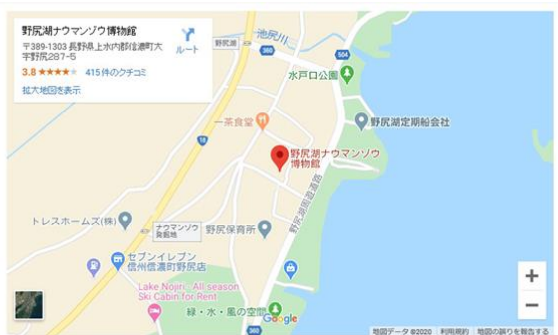
野尻湖ナウマンゾウ博物館周辺の地図