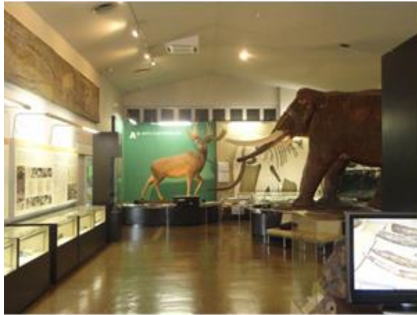
野尻湖ナウマンゾウ博物館の常設展示室（同館 HP より）